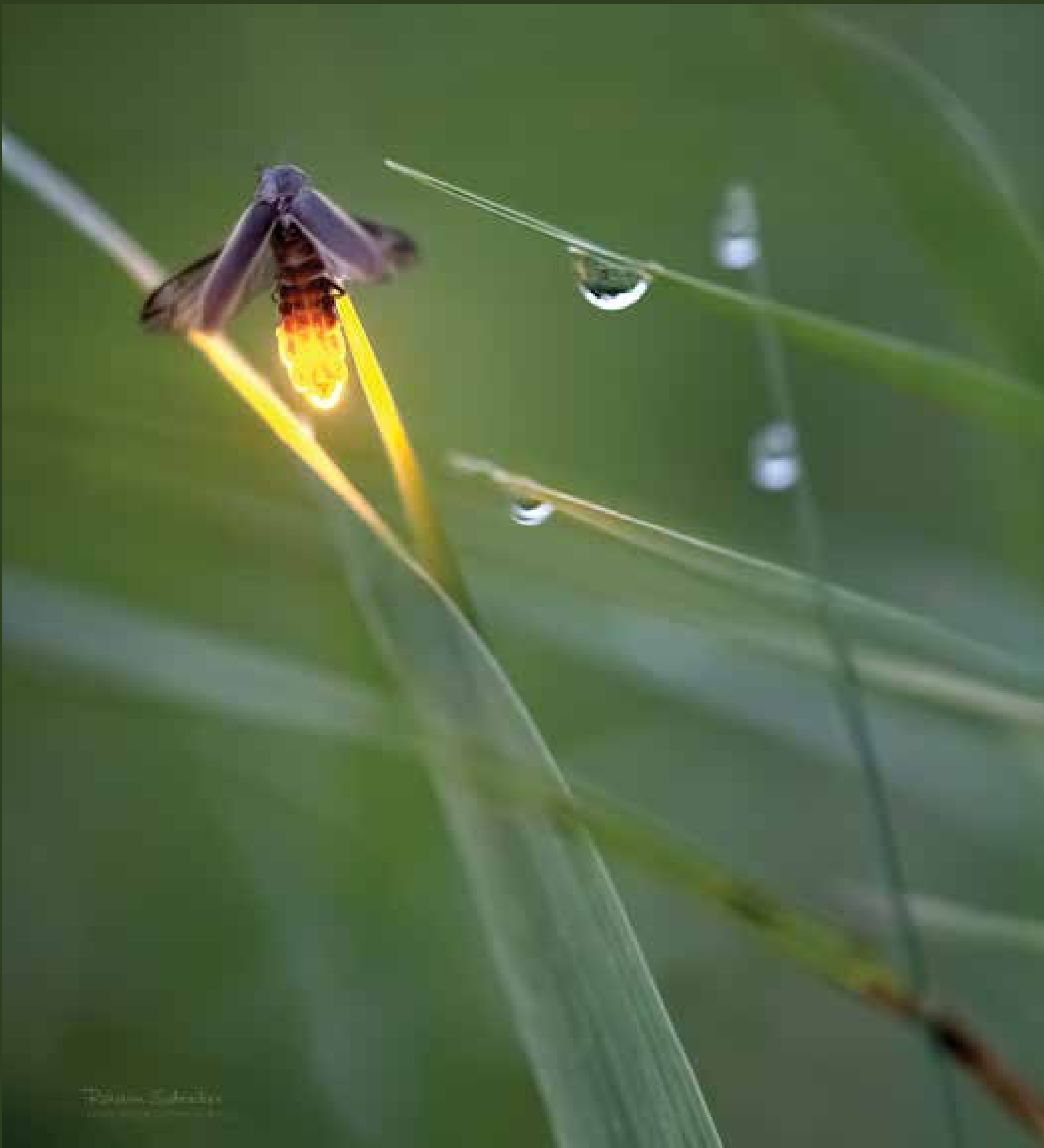
Amber Firefly (Jantarová), 2009, Fairfield, Iowa 2011 – 1. místo v 41. ročníku National Wildlife Federation Photo Contest, 2011 – 1. místo v 8. ročníku Smithsonian Magazine Photo Contest