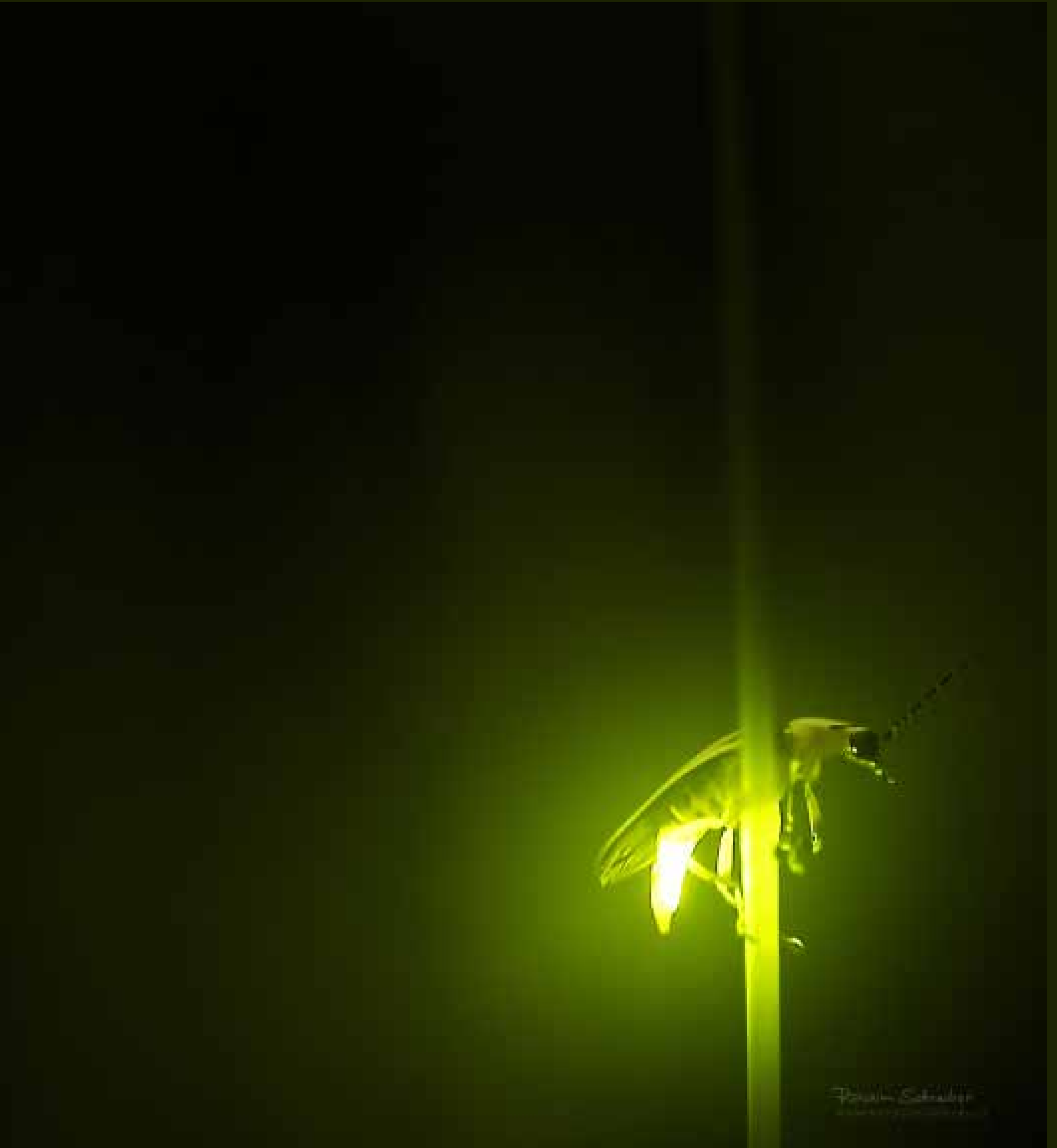
Brightest Light (Nejjasnější světlo), 2016, Fairfield, Iowa