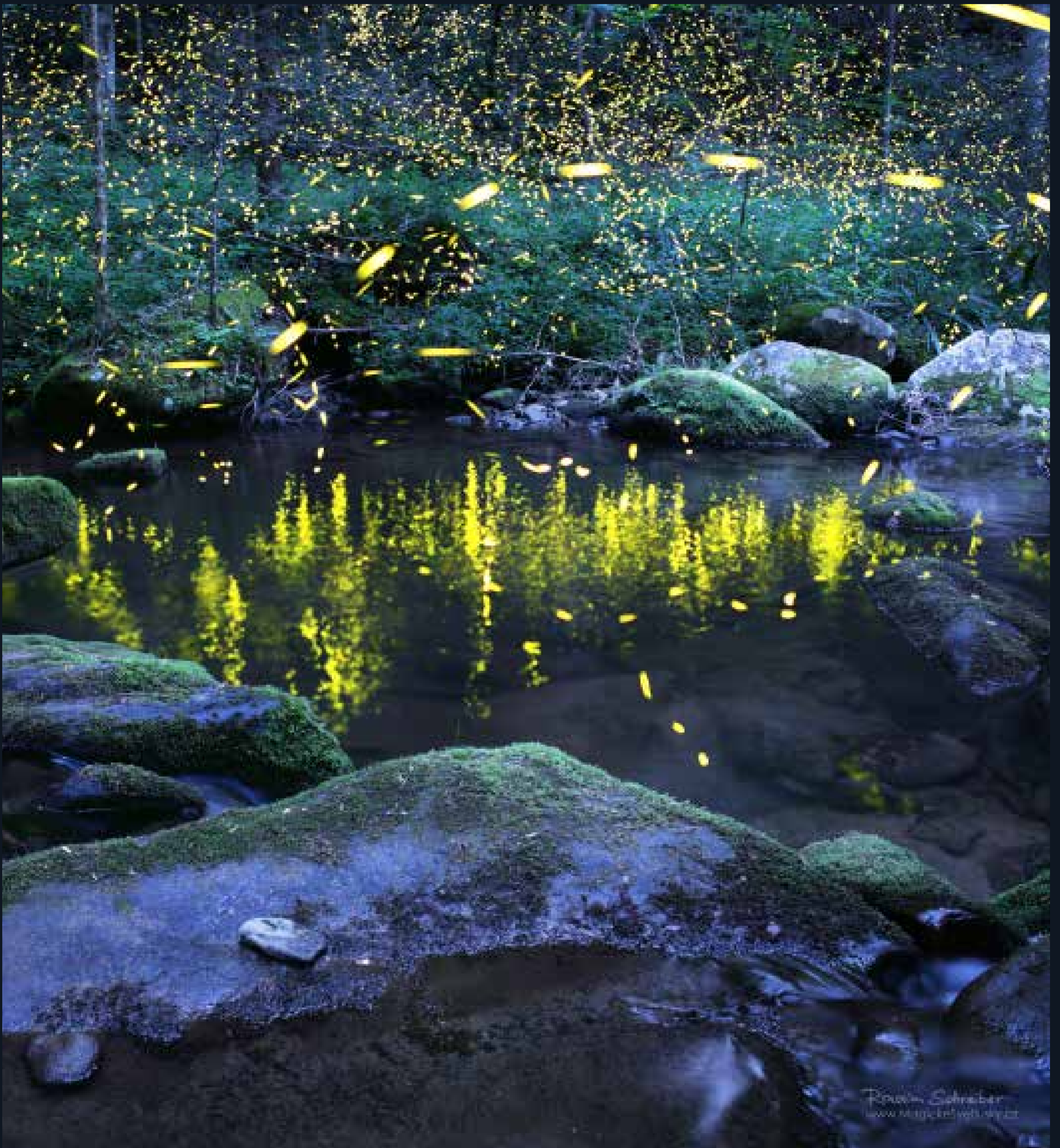
Reflections (Zrcadlení), 2015, Národní park Velké kouřové hory, Tennessee - synchronizující světlušky