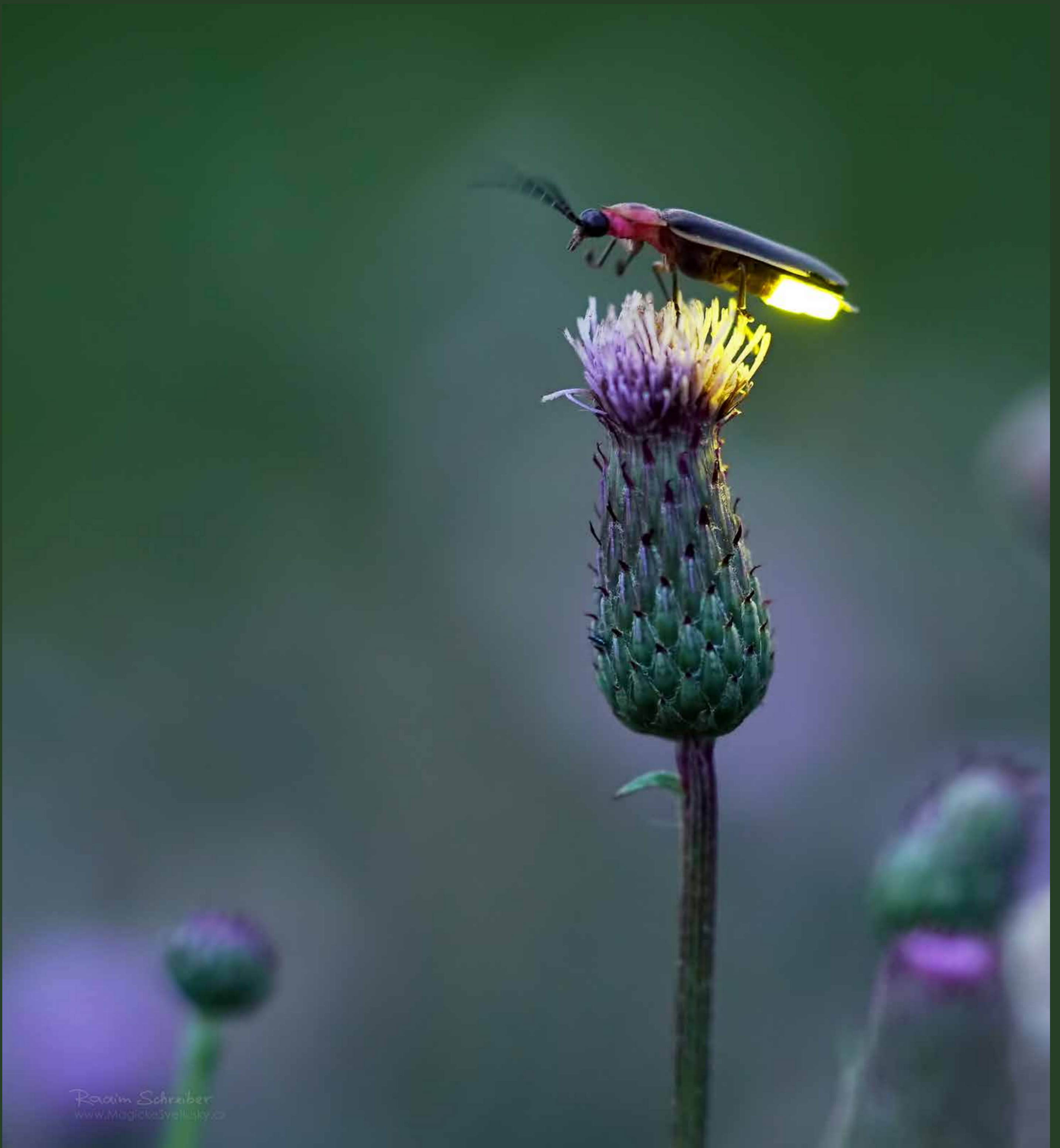
Thistle (Bodlák) 2018, Brighton, Iowa