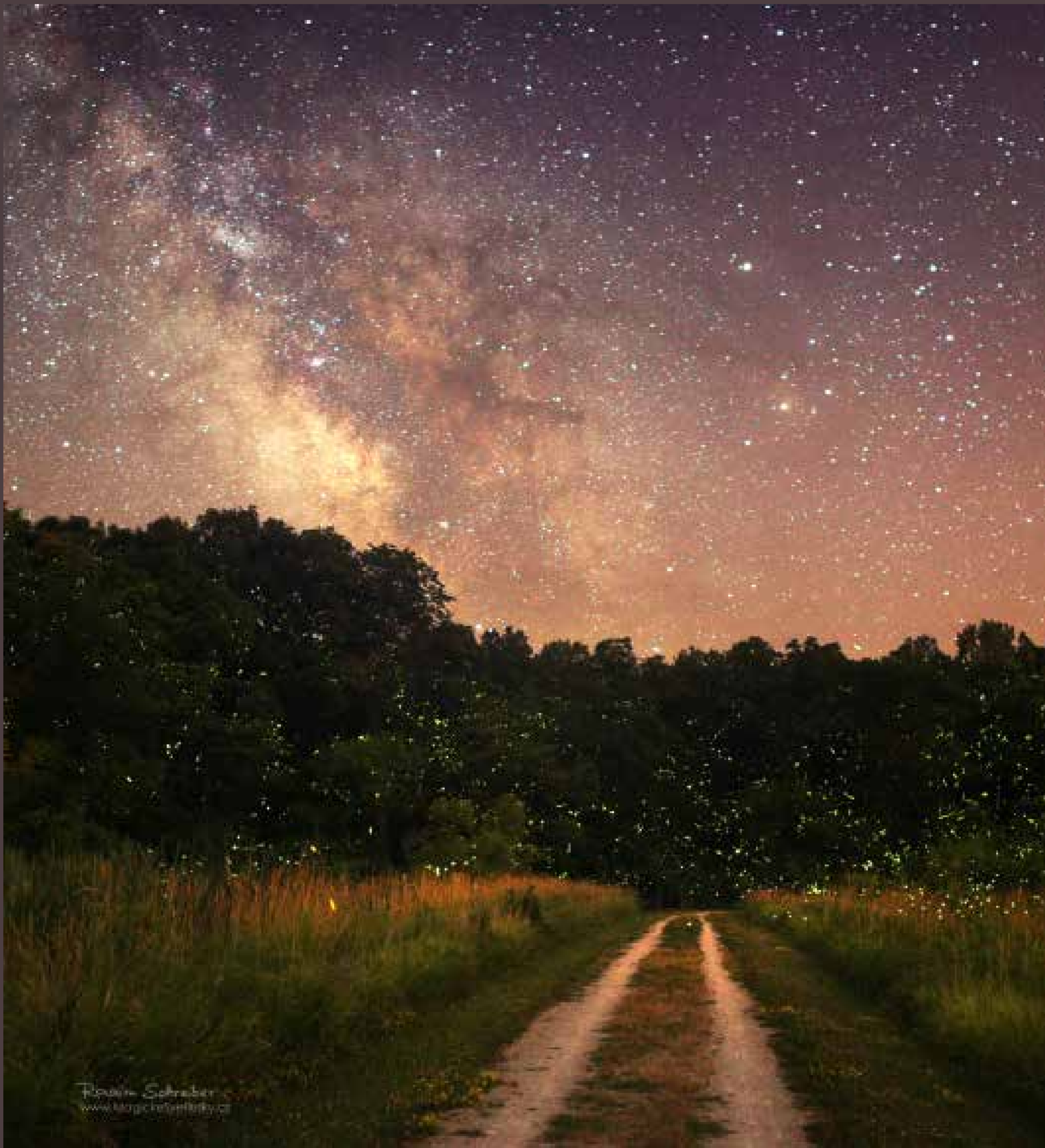
Milky Way (Mléčná dráha), 2017, Fairfield, Iowa - jednorázová expozice trvající 25 sekund.