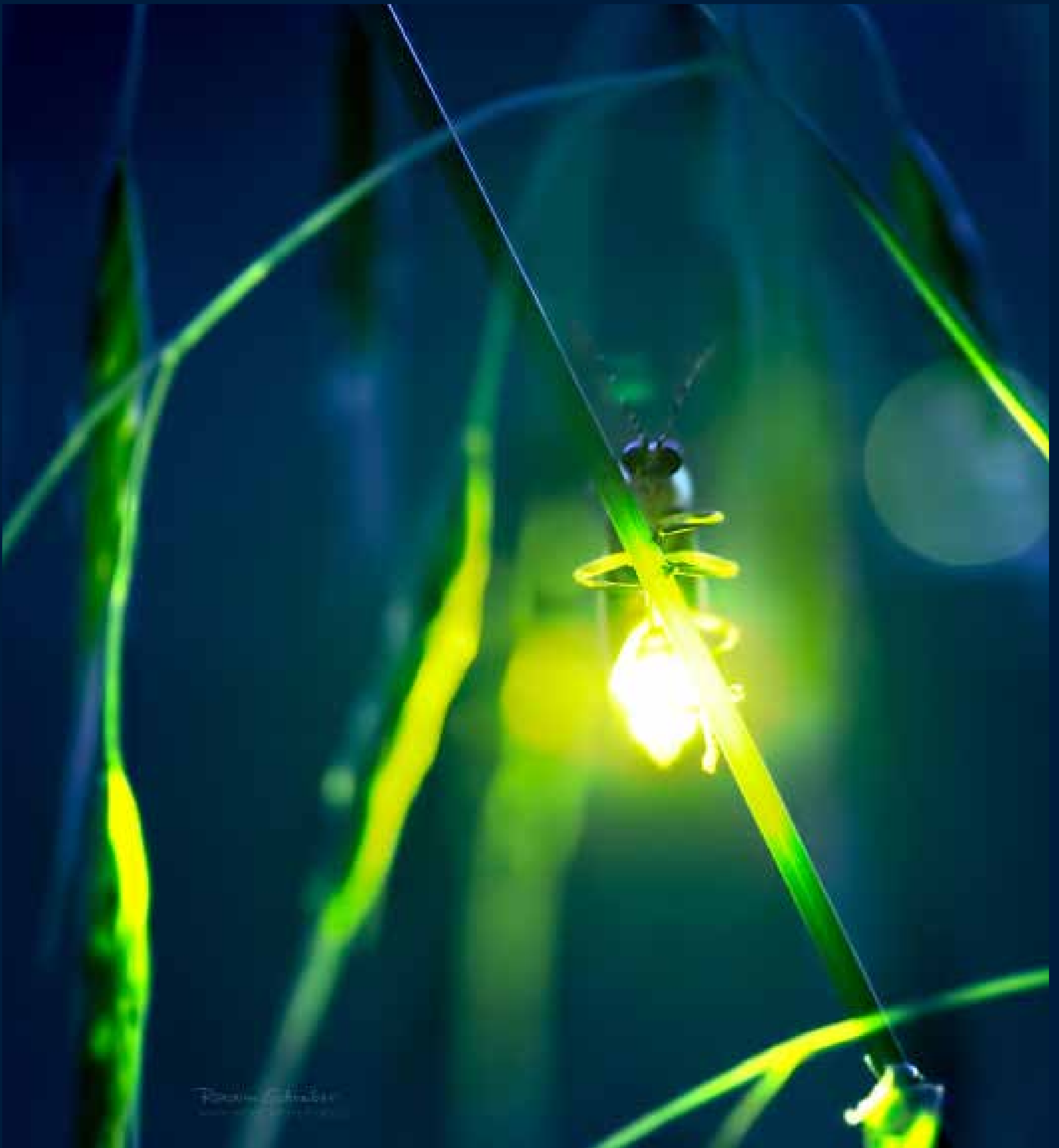
Bioluminescent Glow (Bioluminiscenční záře), 2010, Fairfield, Iowa