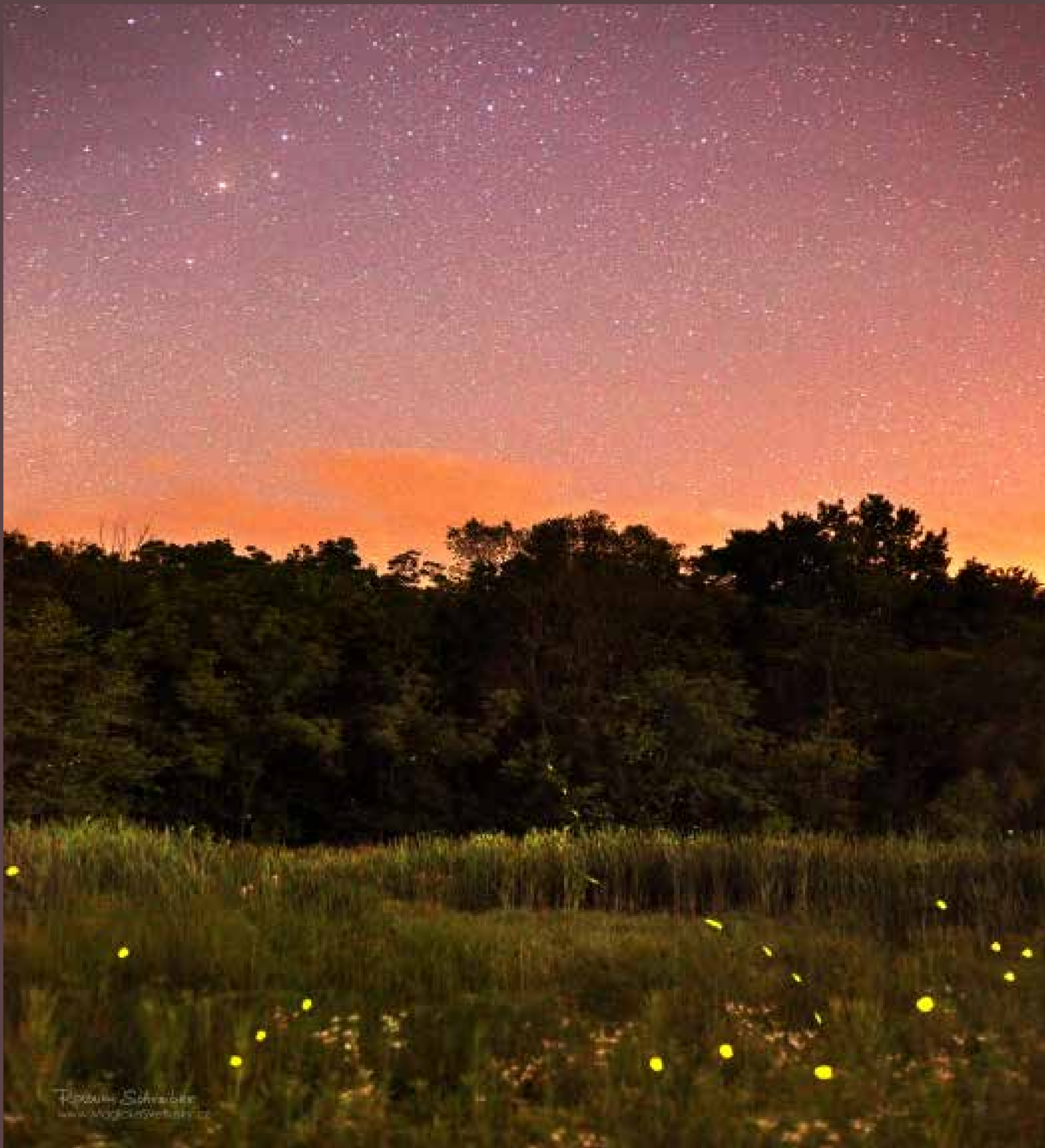
Path to the Stars (Cesta ke hvězdám), 2009, Fairfield, Iowa