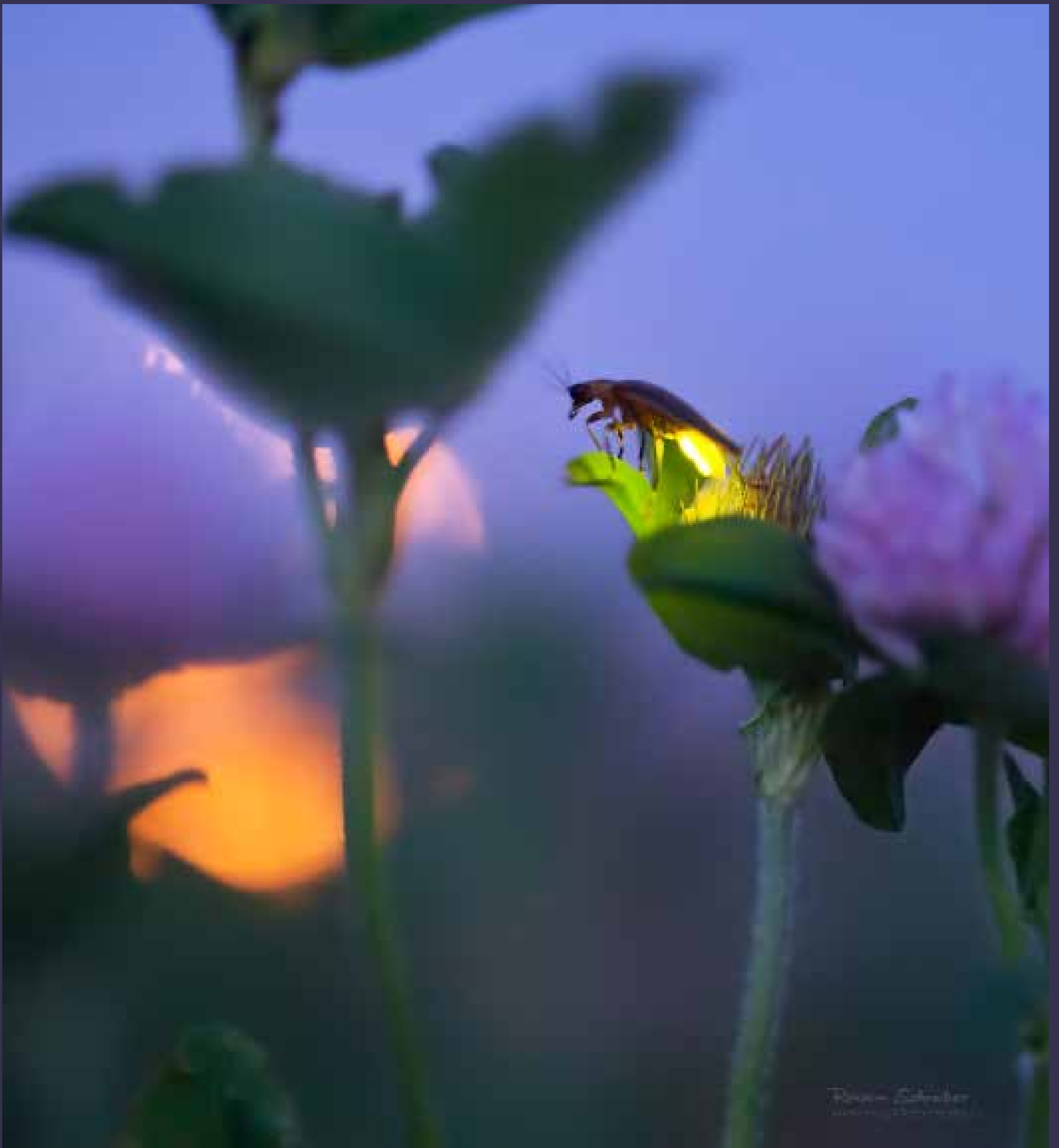
Clover Moon (Měsíc v jeteli), 2012, Brighton, Iowa