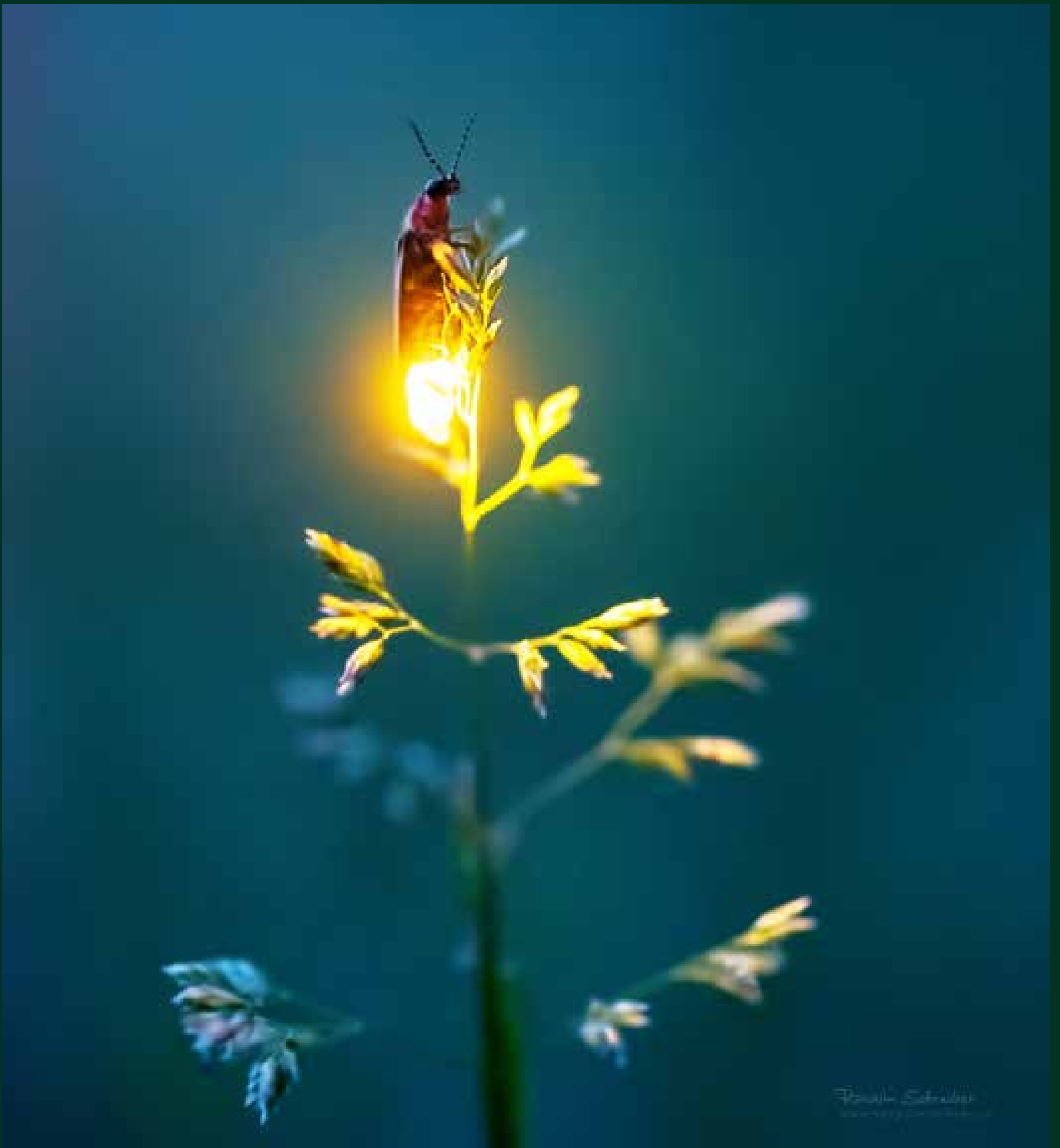
On the Top (Na vrcholku), 2017, u mě na zahradě, Fairfield, Iowa