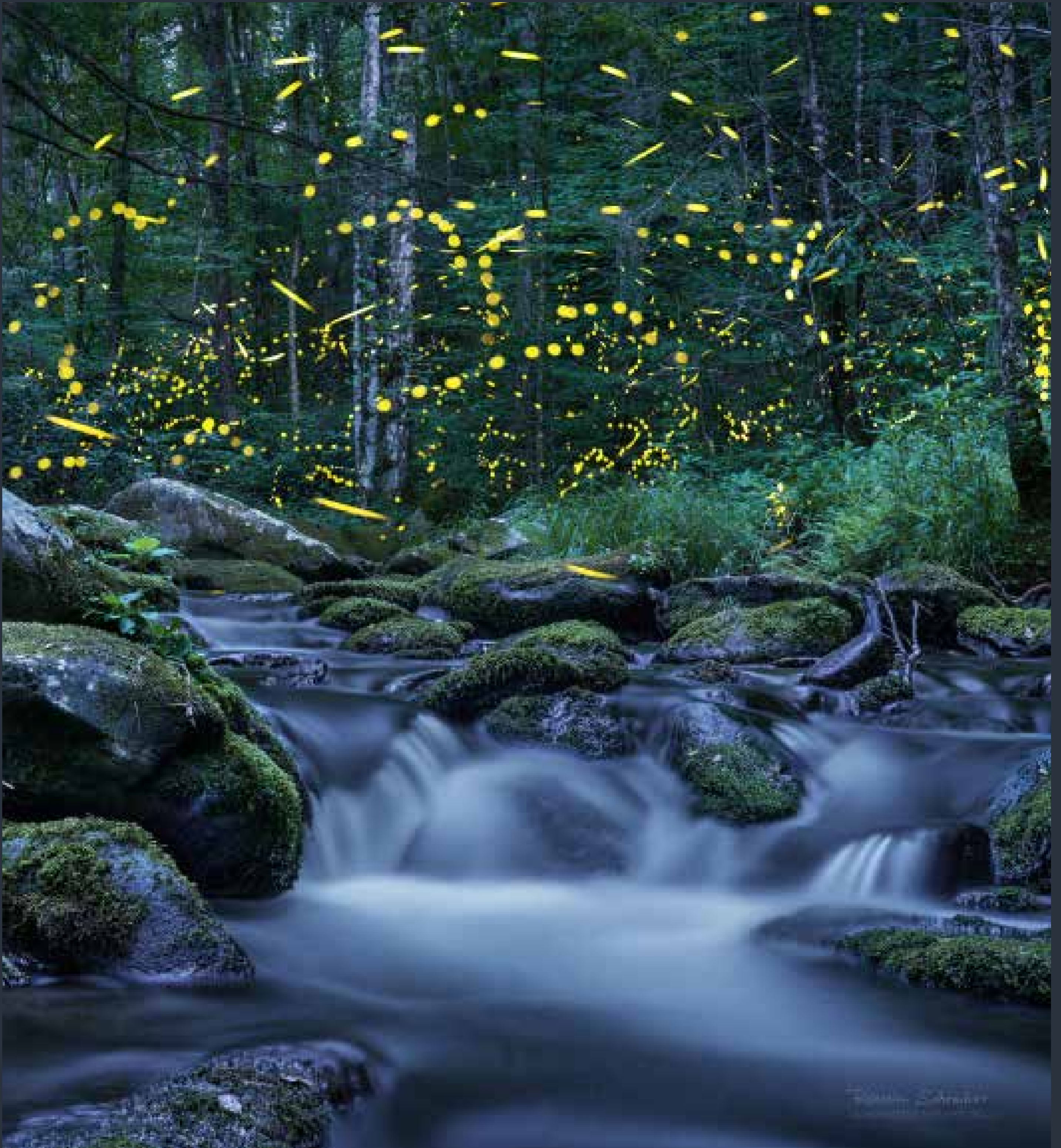
New Waterfall (Nový vodopád), 2019, Národní park Velké kouřové hory, Tennessee - synchronizující světlušky